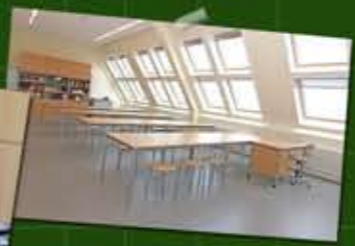
heller Kunstraum, direkt unterm Schuldach