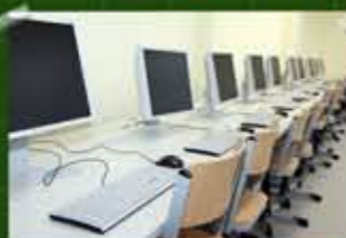
neu ausgestatteter Multimedia-Raum